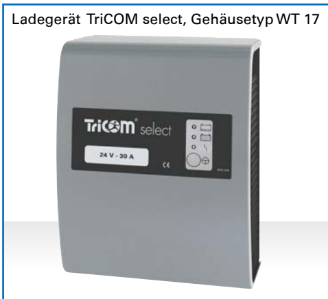
Ladegerät TriCOM select, Gehäuse Typ WT 17