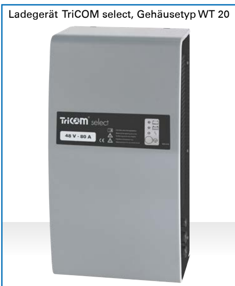
Ladegerät TriCOM select, Gehäuse Typ WT 20